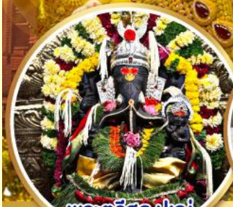
พระศรีศูล ปูเณ (Trishul Pune)