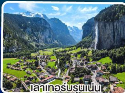
เลาเทอร์บูรนาเป็น