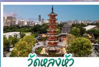
วัดเลงเซ้ง