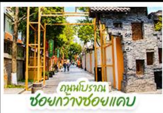
ถนนโบราณ ชอยกว้างชอยแคบ