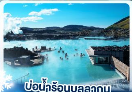
แช่น้ำร้อนบลูลากูน

เก็บไอซ์แลนด์ แดนภูเขาไฟคิรูกูเฟล และ แช่น้ำร้อนบลูลากูน