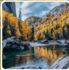
เคนเคทัวไห้