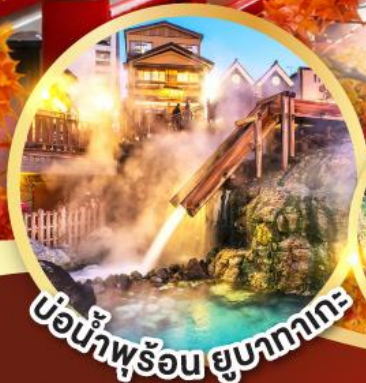
บ่อน้ำพุร้อน ยูบาทากะ