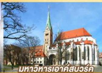
มหาวิหารเอาค์สเวิร์ค