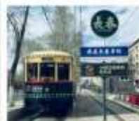
เมืองฉางชุน