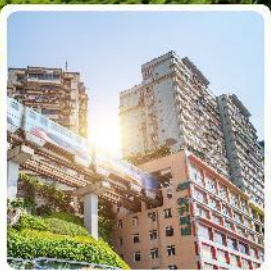
รถไฟทะลุถ้ำ