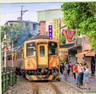
สถานีรถไฟซือเฟิ่น