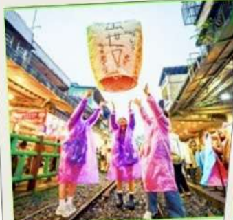
ปล่อยโคมลอย