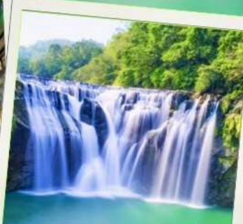
น้ำตกซือเฟิ่น