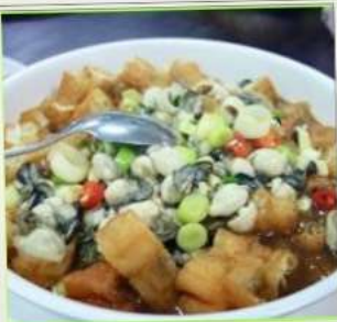
ถนนโบราณซือเฟิ่น