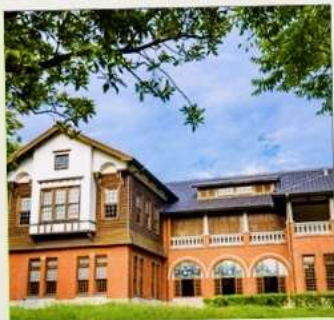
พิพิธภัณฑ์น้ำพุร้อนเป่ย์โถว