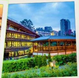
ห้องสมุดเป่ย์โถว