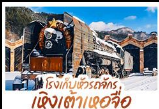
โรงเก็บข้าวตกร, เจิงเต่าเอวโจ