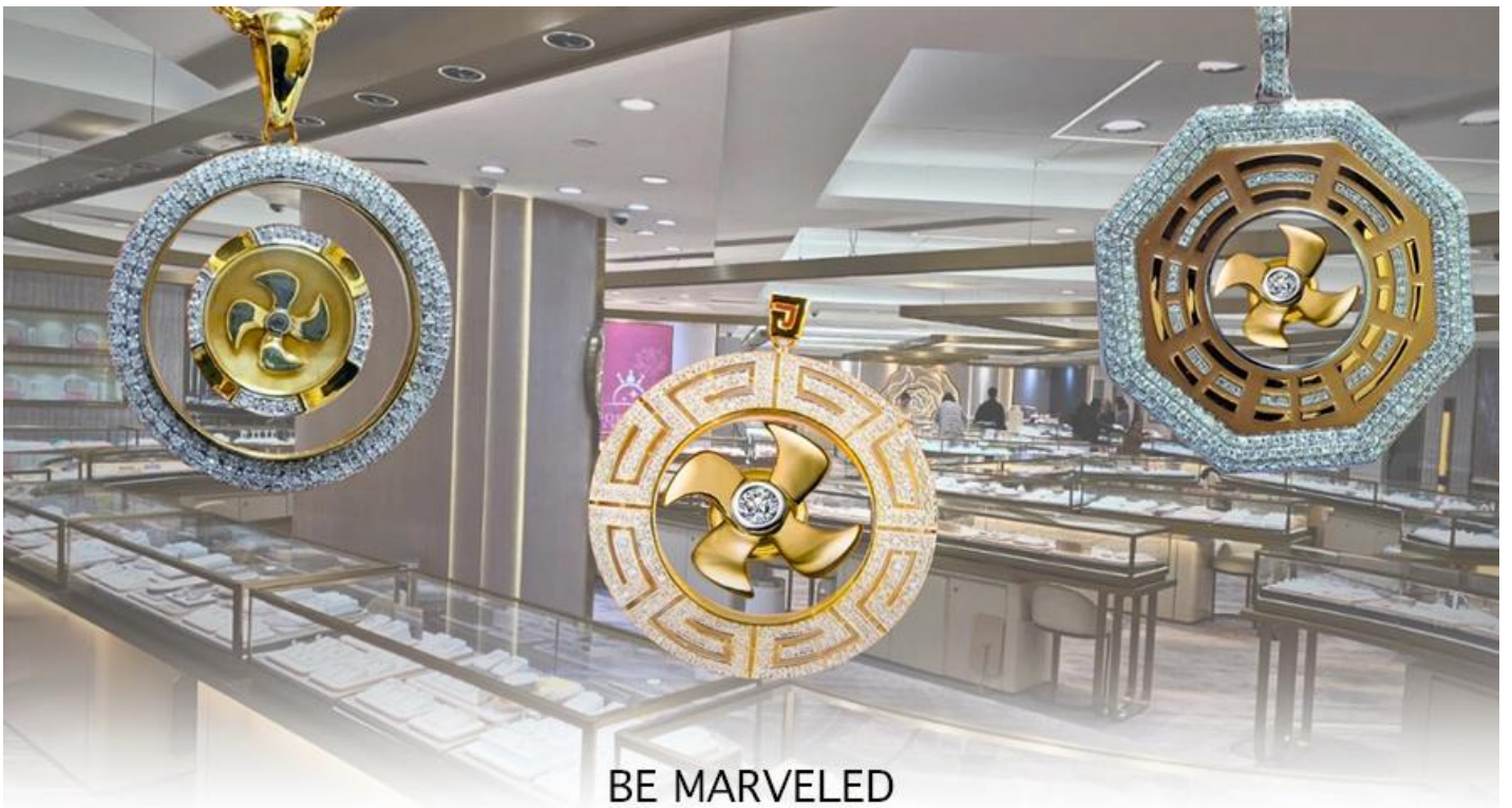
BE MARVELED ศูนย์ฮวงจู้ย กังหันเศรษฐี

นำท่านชม ศูนย์ฮวงจู้ย กังหันเศรษฐี ที่ขึ้นชื่อของฮ่องกง ท่านจะได้พบกับงานดีไซน์ที่ได้รับรางวัลยอดเยี่ยม และใช้ในการเสริมดวงเรื่องฮวงจู้ย ศูนย์ฮวงจู้ยกังหันเศรษฐี วัดเซกุง" ไม่ใช่ชื่อวัดโดยตรง แต่เป็นชื่อที่เกี่ยวข้องกับ วัดเซกุงหมิว (Che Kung Temple) ในฮ่องกง ซึ่งเป็นที่รู้จักกันดีในเรื่อง กังหันนำโชค ที่เชื่อว่าสามารถหมุนปิดเป่าสิ่งชั่วร้ายและนำโชคลาภเข้ามาในชีวิต