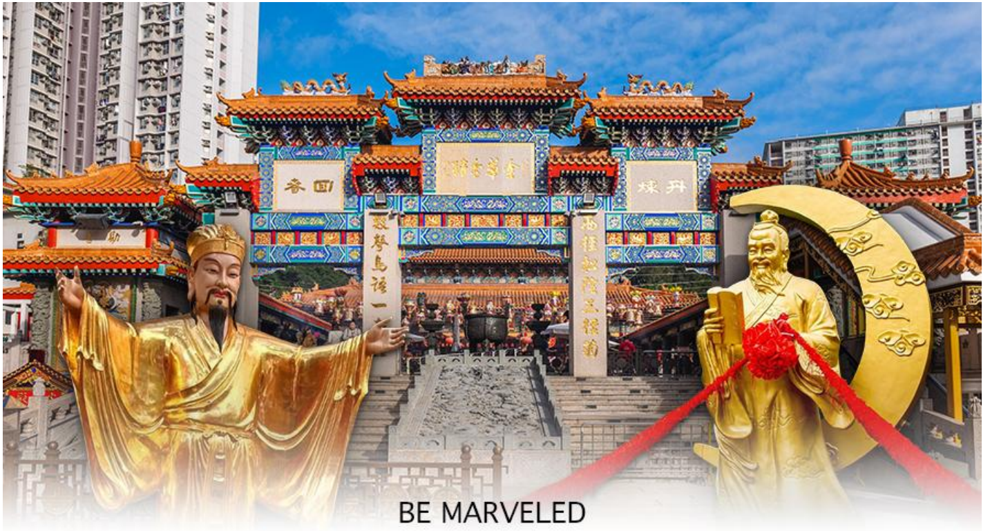
BE MARVELED วัดหวังต้าเซียน

มาเผยแพร่ศาสนาในฮ่องกง และสร้างวัดแห่งนี้ขึ้นมาเมื่อประมาณปีค.ศ. 1921 ค่ะ ภายในวัดจะมีทั้ง เทพเจ้าหวังต้าเซียน, เจ้าแม่กวนอิม, เจ้าที่, เทพเจ้าหยุกโหลว (เทพเจ้าแห่งความรัก), ท่านขงจื้อ ซึ่งคนฮ่องกงเอง และนักท่องเที่ยวก็จะมากราบไหว้เพื่อสิริมงคลกัน โดยเฉพาะอย่างยิ่งคือ เทพเจ้าหยุกโหลว หรือ เทพเจ้าแห่งความรัก ที่เราเรียกกันว่า เทพเจ้าด้ายแดง เป็นพิภคที่หลายๆคนมักจะไปขอความรักจากท่านกัน นอกจากนี้ที่เราจะต้องเอาด้ายแดงมาพันมือนี้นะ ตามป้ายที่แนะนำข้างหน้าแล้ว โกวัดนี้เที่ยวคนฮ่องกงบอกว่าถ้าเป็นผู้หญิงอย่างเราอยากได้แฟน ก็ต้องไปผูกด้ายที่รูปปั้นผู้ชายและพอไหว้เสร็จแล้วก็อย่าลืมหยอดทำบุญใส่ตู้ไปด้วย