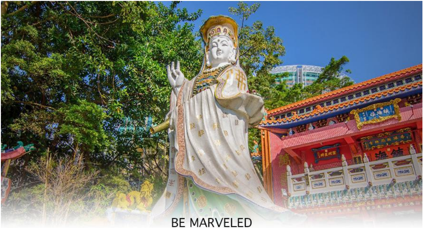
BE MARVELED วัดเจ้าแม่กวนอิมริพลส์เบย์