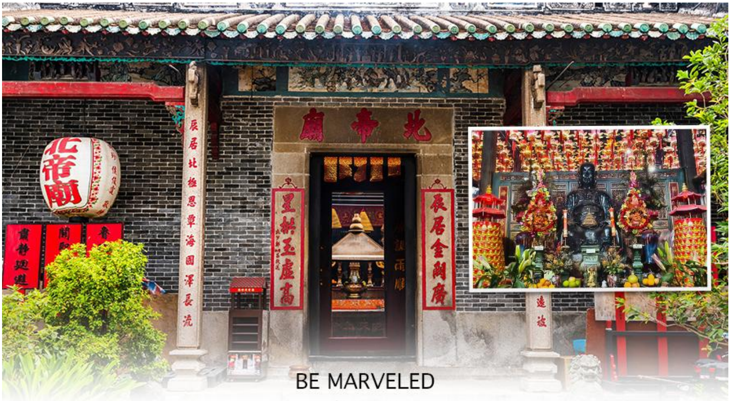
BE MARVELED วัดปักไต้

จากนั้นนำท่านขอปิ้ง ย่านมงก๊อก (MONG KOK) เป็นแหล่งช้อปปิ้งที่เต็มไปด้วยตรอกซอกซอยที่มี เอกลักษณ์แปลกตา รวมทั้งตลาดเก่าแก่ที่สะท้อนเสน่ห์และวิถีชีวิตของคนท้องถิ่น ถือเป็นหนึ่งในย่านยอดนิยมที่นักท่องเที่ยวทุกคนต้องแวะเวียนมา มีร้านสวยๆ บาร์เท่ๆ หลบซ่อนตัวอยู่มากมาย ภายในย่านมีตลาดนัด LADIES' MARKET ขนาดใหญ่ซึ่งมีร้านขายเสื้อผ้า เครื่องสำอาง รองเท้า กระเป๋า เครื่องประดับมากมาย อีกทั้งยังมีร้านอาหาร และเครื่องดื่ม ที่ขึ้นชื่อหลากหลายชนิด ให้ทุกท่าน ได้ลองลิ้มรสอีกมากมาย