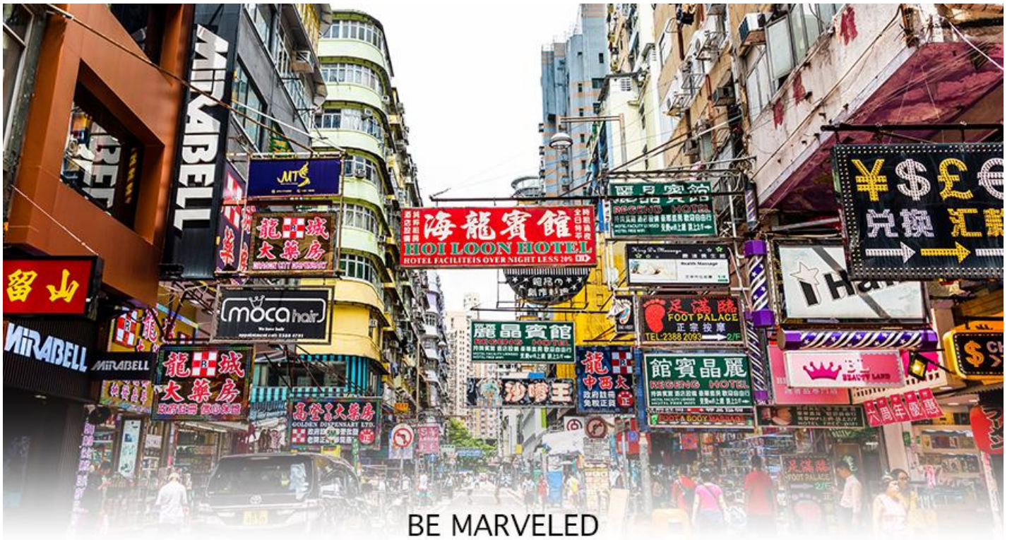
BE MARVELED MONGKOK

☉ อิสระอาหารอาหารเย็นตามอัธยาศัย **เพื่อความสะดวกในการช้อปปิ้ง**