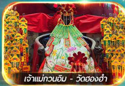
เจ้าแม่กวนอิม - วัดสองอ่า