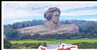
เกาะสามจิวจีโจว