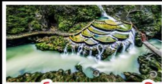
แกรนด์แคนยอนกงเหริน

เขาฟานจิง - เมืองโบราณฝูเจียง เมืองโบราณเฟิ่งหวง - เกาะสามจิวจีโจว แกรนด์แคนยอนกงเหริน - ไม้เข้าน้ำร้อน พักรีสอร์ท 5 ดาว - รถไฟความเร็วสูง