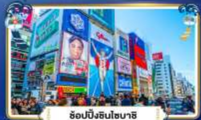
ฮอปบิงชินโซบาสึ