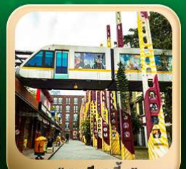
“ตงเจียวจี้”