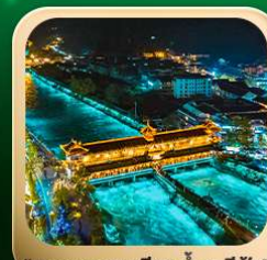
“สะพานหนานเฉียว น้ำคาสีฟ้า”