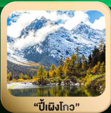
“ปี้ผิงโกว”

ชมธรรมชาติ 2 อุทยานขึ้นชื่อ อุทยานภูเขาสี่ครุณี + อุทยานปี้ผิงโกว สะพานหนานเฉียว • ถนนคนเดินไท่กู่หลี่ + ซุนซีลู่ + Pop Mart • ตงเจียวจี้