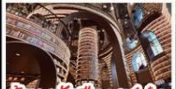
ร้านหนังกุ้งงูเก๋