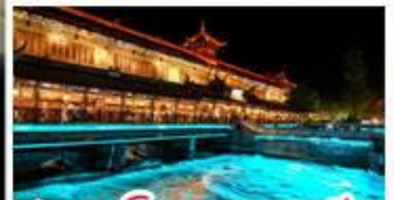
สะพานโบราณหนานเฉียว