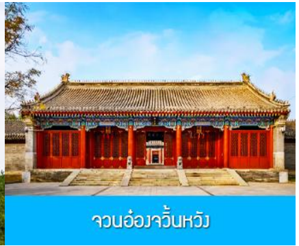
จวนอ๋องจวินหวัง

วันที่หก เมืองเออร์ดอส -อี้ค้อเอ้าเป่า-พิพิธภัณฑ์เครื่องเงิน-จวนอ๋องจวินหวัง- สวนวัฒนธรรมหมงกู่หยวน หลิว-ช้อปปิ้งถนนคนเดิน