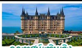
ฤดูหาสมบัติหวิงเจิง

เมืองท่าชิงเต่า - ฤดูหาสมบัติหวิงเจิง เบียร์ชิงเต่า + อาหารทะเล สตรีทอาร์ต สตูดิโอจิบลิ