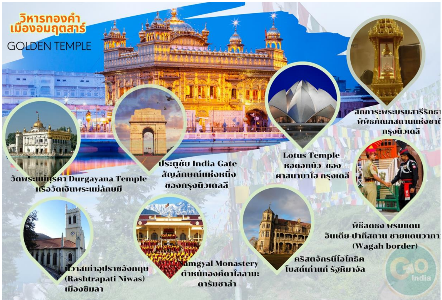
วัดพระแม่สุคา Durgayana Temple หรือวัดเงินพระแม่ลักษมี