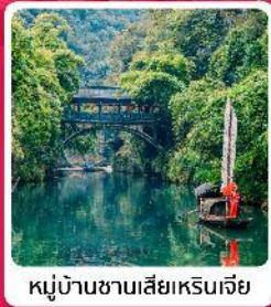
หมู่บ้านชานเสี่ยเหรินเจีย