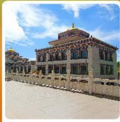
ทำเนียบพระลามะอุหลาน

• ไฮไลท์ เป็นทราseyเสียงชาวมองโกลแห่งท้องถิ่นระดับ 5A ของจีน แกรนด์แคนยอนแม่น้ำเหลือง ซิวอูฐท่ามกลางทะเลทราย