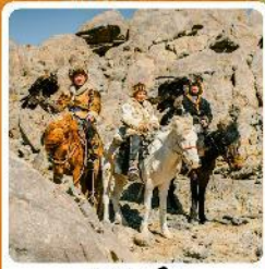
ชาวมองโกล