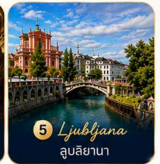
5 Ljubljana ลูบลิยานา