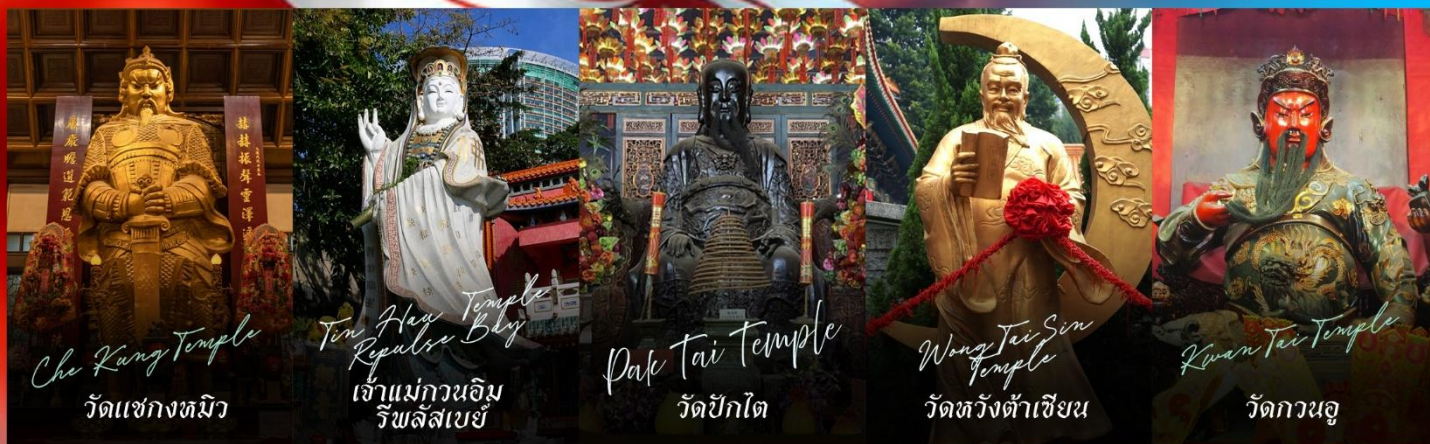
Che Kung Temple วัดแชกงทมิว

รายการทัวร์ข้างต้นอาจมีการปรับเปลี่ยนเพื่อความเหมาะสม