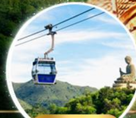
รวมกระเช้าฮ่องกง