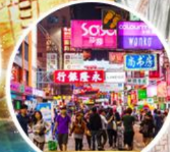
Shopping Taim Sha Tsui