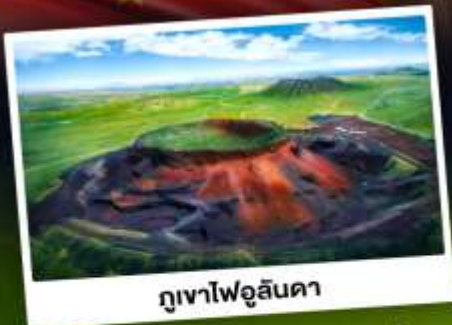
ภูเขาไฟฟูสันดา

ท่องเที่ยวแดนแห่งทะเลทรายและทุ่งหญ้า ชมพระอาทิตย์ขึ้นทุ่งหญ้าออร์ดอส