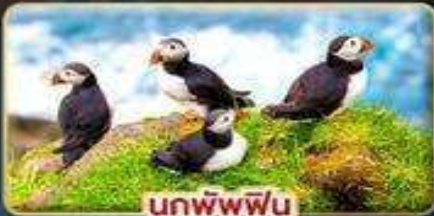
นกพิงฟิน

📅 เดินทาง : 30 เม.ย. - 07 พ.ค. | 23-30 ก.ค. 69