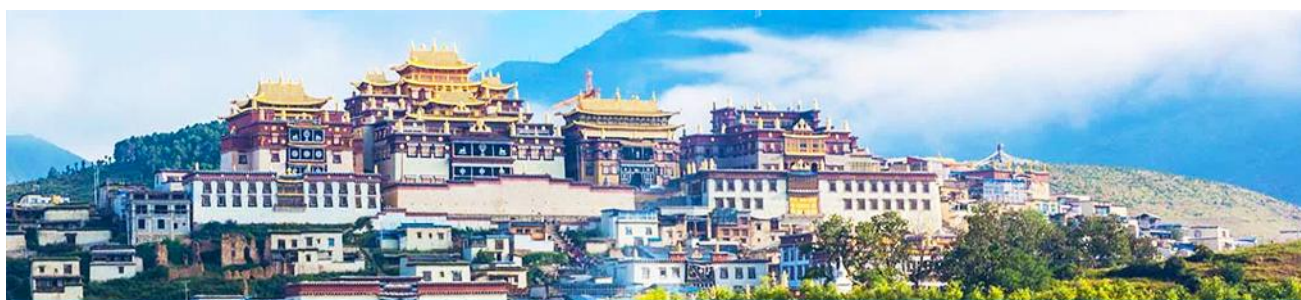
เมืองโบราณเซวกริลา