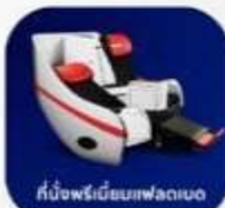
ที่นั่งพรีเมียมเฟลตเบด

บริการอาหารร้อน และ น้ำดื่ม บนเครื่อง ขาไป และ ขากลับ