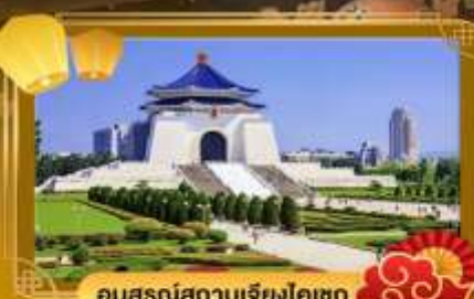
อนุสรณ์สทบ้นจ้ยงค้ค้ท