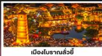
เมืองโบราณลั่วหยี่