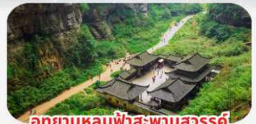
อุทยานหลุมฟ้าสะพานสวรรค์