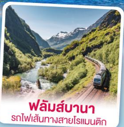
ฟลัมส์บานา รถไฟเส้นทางสายโรเมนติก