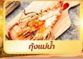
กุ้งแม่น้ำ