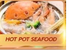
HOT POT SEAFOOD