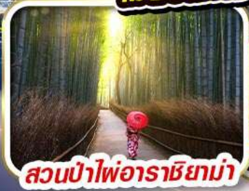
สวนป่าไฟอาราชิยาม่า