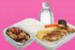
บริการอาหารร้อนบนเครื่อง ซาโป - ซากสับ