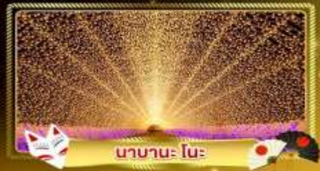
นานานะ โนะ