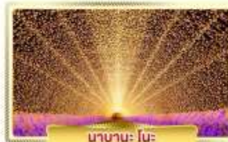
นานานะ โนะ