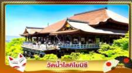
วัดน้ำสกลโยมิชิ

ชมงานประดับไฟสุดอลังการ นานานะ โนะ ซาโตะ