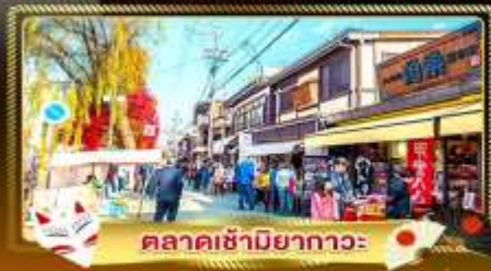
ตลาดซามิยากาวะ