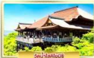
วัดน้ำใสคิโยมิสึ