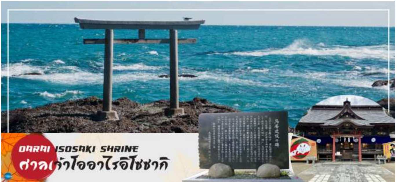
ORAI ISOSAKI SHRINE ศาลเจ้าโอรाइโซซากิ

เดินทางสู่ ศาลเจ้าโอรाइโซซากิ (Orai Isosaki Shrine) ศาลเจ้าที่มีประวัติศาสตร์ยาวนาน ตั้งอยู่บนเนินเขาหันหน้าสู่มหาสมุทรแปซิฟิก เป็นหนึ่งในเสาโทริอิขนาดใหญ่ที่มีชื่อเสียงในภูมิภาคคันโต ถูกเลือกให้เป็นทรัพย์สินทางวัฒนธรรมแห่งจังหวัด และได้รับความเชื่อถือมาอย่างยาวนานในฐานะเทพเจ้าผู้ให้ความคุ้มครองการคมนาคมทางทะเล และความสงบสุขภายในครอบครัว นำท่านรับพลังงานบวก ณ เสาโทริแห่งคามิอิโซะ (Kamiiso no Torii) โทริอิสี่เสาที่นิ่งสงบ บนโขดหินท่ามกลางฟองคลื่นสีขาวที่สาดกระเซ็น ซึ่งเป็นที่ประดิษฐานของเทพเจ้าโอนามิจิโนะมิโคโตะ และเทพเจ้าสุคะฮิโคะโนะมิโคโตะ สร้างขึ้นตั้งแต่ 29 ธันวาคม ค.ศ.856 รวมทั้งยังเป็นจุดถ่ายรูปพระอาทิตย์ขึ้นที่มีชื่อเสียง มีนักท่องเที่ยวมากมายมาเฝ้าคอยเพื่อเก็บภาพช่วงเวลาแสงตะวันสาดส่องขึ้นสู่ขอบฟ้า