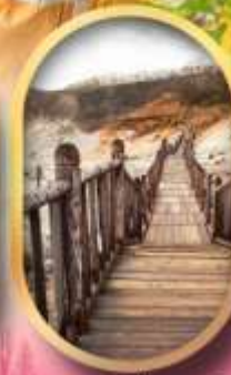
หุบเขาจิทอกุคาบิ