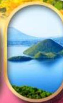
อ่าวทะเลสาบโทโยะ