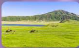
ภูเขาไฟอะโสะ ทุ่งหญ้าคุสะเซนริ