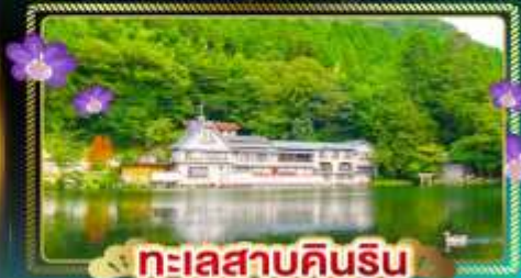
ทะเลสาบคินริน