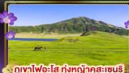
ภูเขาไฟอะโฮะทุ่งหญ้าคุสะเซนริ