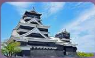
ปราสาทคุมามาโด้