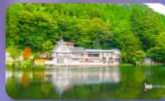
ทะเลสาบคินริน