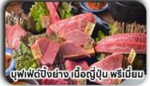
บุฟเฟ่ต์บิงย่าง เนื้อญี่ปุ่น พรีเมียม