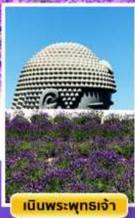
เจดีย์พระพุทธรเจ้า