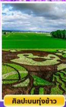
ศิลปะบนทุ่งข้าว