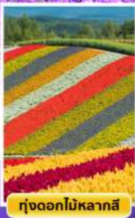
ทุ่งดอกไม้หลากสี