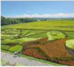
ดิลปะบนทุ่งนา