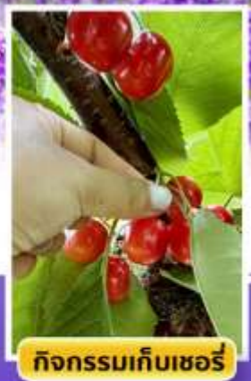
กิจกรรมเก็บเชอร์รี่

ออนเซ็น 2 คืน นน.กระบี่เป่า 23 กก. 1 ใบ 6Days 4Night