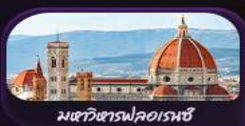
มหาวิหารฟลอเรนซ์