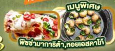
เมนูพิเศษ พิซซ่ามากริตต้า, หอยเอสคาโก้