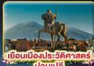
เยือนเมืองประวัติศาสตร์ ปอมเปอี