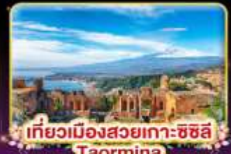
เที่ยวเมืองสวยเกาะซซิลี Taormina