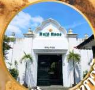
เมืองอาหาร