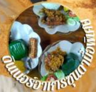
อาหารพื้นเมือง

หนึ่งในแดน ที่มีชื่อเสียงที่สุด ในซอร์บากาตา