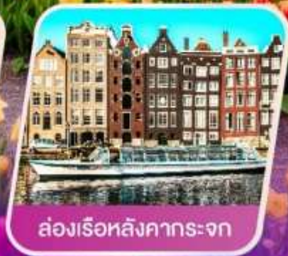
ล่องเรือหลังคากระຈก