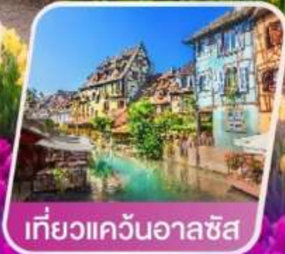
เที่ยวแคว้นอาลซัส