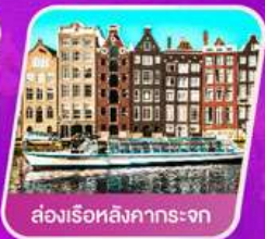
ส่องเรือสิงคารถะจก

เที่ยวเทศกาลดอกไม้เคอเคนฮอฟ ชมแคว้นอาลซัส หมู่บ้านสวยที่สุดในฝรั่งเศส เยือนเมืองมรดกโลก