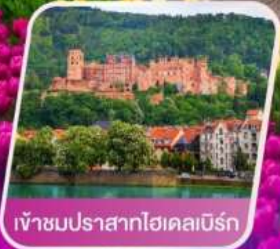
เข้าชมปราสาทไฮเคลมเบิร์ก