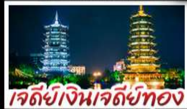
เจตีย์เงินเจตีย์ทอง

หมู่บ้านแม้วซีเจียง - จิวจ้ายโกวน้อย - เสียวซีโหว เมืองโบราณเขยฮือ+ล่องเรือ - เจตีย์เงินเจตีย์ทองวิวคำ เขางวงช้าง - สะพานแดงหรูอี้ - รถไฟความเร็วสูง ไม่ลงร้านช้อปปิ้ง - เมบูพิศษ บูฟเฟต์ชาบูซีฟู้ด ปลายทางเมือง เพื่อคริสตัส สุกั๊ก