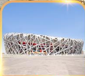
สนามกีฬารังนก