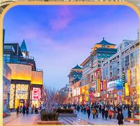
ถนนหวงฟู่จิ่ง